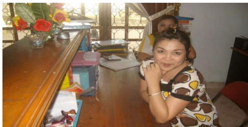
Gambar Situasi Kerja Karyawan

memaksimalkan laba usaha. Informasi yang teratur tersusun dengan baik serta terprogram memberikan nilai positif bagi usaha yang sedang berjalan. Komunikasi lancar, input data cepat melalui komputer lancar menjadikan bisnis berkembang.