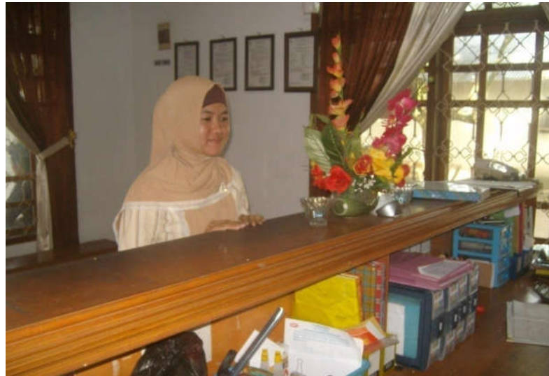
Gambar Nasabah PT. Berkah Morindo Amurang

Kendala-kendala yang dihadapi PT. Berkah Morindo Amurang dalam menjalankan usaha antara lain: