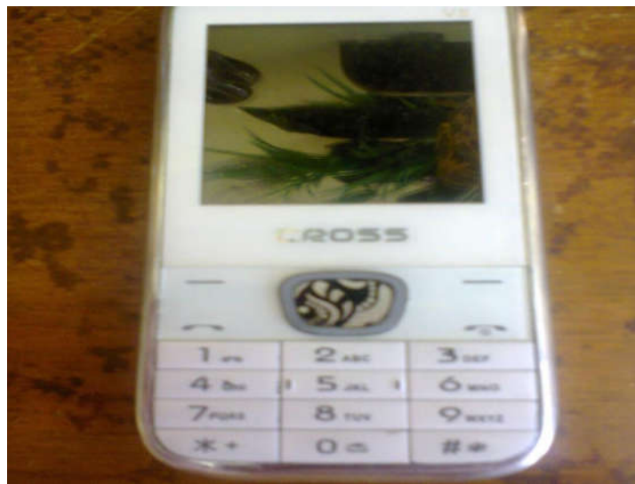
Gambar sarana penunjang kegiatan usaha

Kesulitan dalam memenuhi persyaratan bisnis seperti program pengolahan data yang siap untuk menginput data secara online menjadi salah satu acuan PT. Berkah Morindo Amurang untuk meningkatkan usaha yang sedang berjalan. Penggunaan sistem informasi yang terprogram membantu perusahaan berkembang maju dan pesat lebih cepat. Kebutuhan masa depan PT. Berkah Morindo Amurang juga harus disiapkan sejak saat ini sehingga hadirnya persaingan bisnis jasa peminjaman uang dan jual beli kendaraan roda dua maupun roda empat baik baru ataupun bekas dapat diantisipasi sedini mungkin. Agar dapat mengembangkan rencana sistem informasi strategis, organisasi harus memiliki pemahaman yang baik tentang kebutuhan informasi jangka pendek maupun jangka panjang.