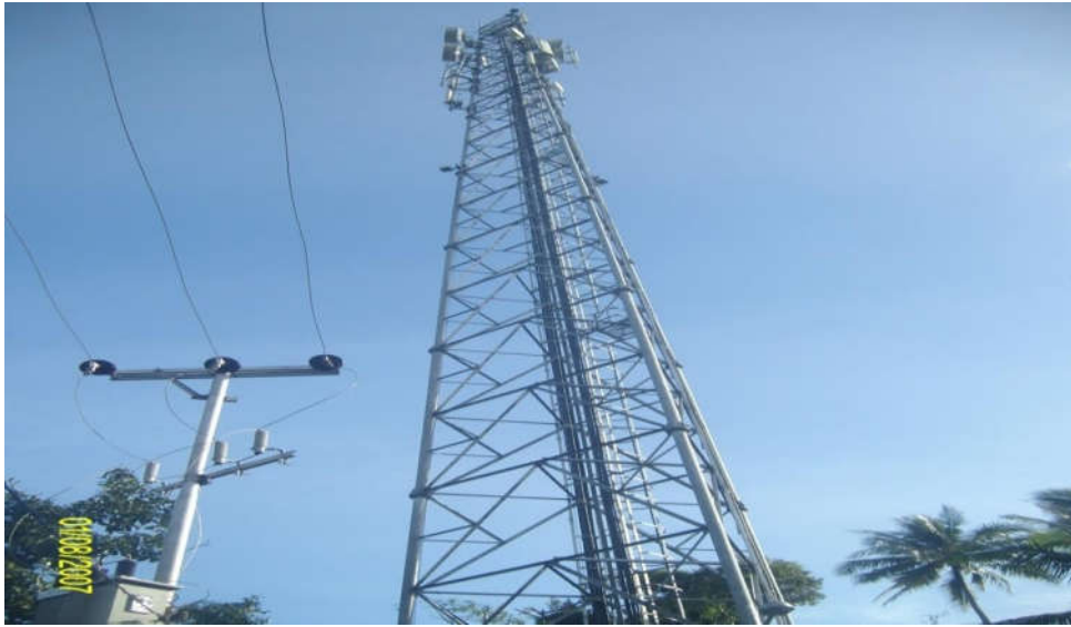
Gambar Tower yang membantu sistem informasi

Informasi akan terakses lancar apabila ada sarana pendukung yang tersedia. Tower yang membantu sistem informasi menjadi salah satu sarana yang memaksimalkan kelancaran komunikasi dengan sinyal baik. Informasi merupakan penentu keefektifan bisnis cepat dan menguntungkan karena dapat menghemat waktu guna penekanan pengeluaran biasa PT. Berkah Morindo Amurang menjadi salah satu perusahaan yang dipilih nasabahnya untuk meminjam uang atau menjual serta membeli kendaraan roda dua, kendaraan roda empat baik baru atau bekas. Nasabah banyak memilih PT.