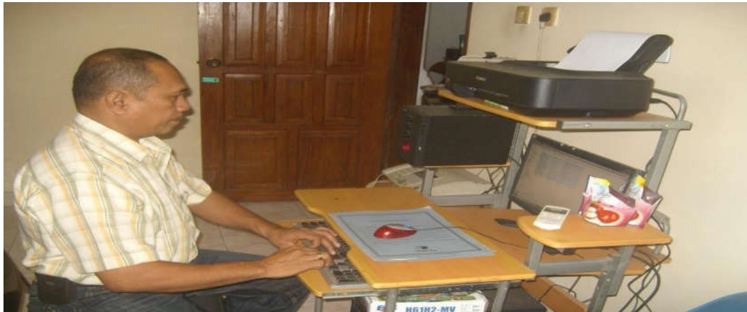
Gambar Kegiatan kerja karyawan

alasan ekonomi menyediakan pelayanan yang lebih baik serta menyediakan tempat kerja yang lebih baik.