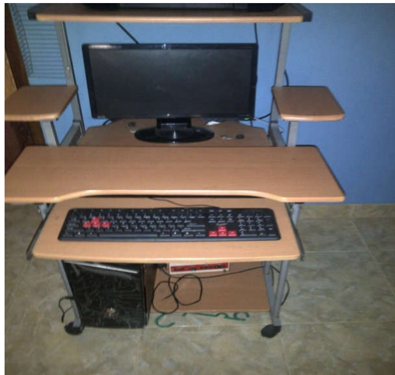
Gambar Perangkat Komputer penunjang kegiatan perusahaan

Komunikasi yang terjalin dengan baik dari perusahaan maupun nasabah mempermudah pengelolaan dan peredaran produk atau jasa dalam bisnis. Handphone menjadi sarana utama dalam sistem informasi dengan cepat dan tepat.