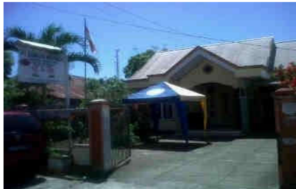
PT. Berkah Morindo Amurang

kendaraan roda empat baru maupun bekas, serta penggunaan handphone untuk mempermudah komunikasi antara staf atau karyawan perusahaan atau dengan nasabah.